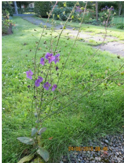
Text och foto: Magnus och Linnéa Andersson

Violkungsljuset blommade vidare i augusti och fram till 25 september då nattfrost tog den. Denna växt roade och engagerade oss hela sommaren. Nu undrar vi om den återkommer nästa år.