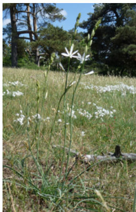
Stor sandililja, Verkaån och en obestämd orkidé