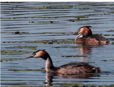
Skäggdoppingar och svarttärna