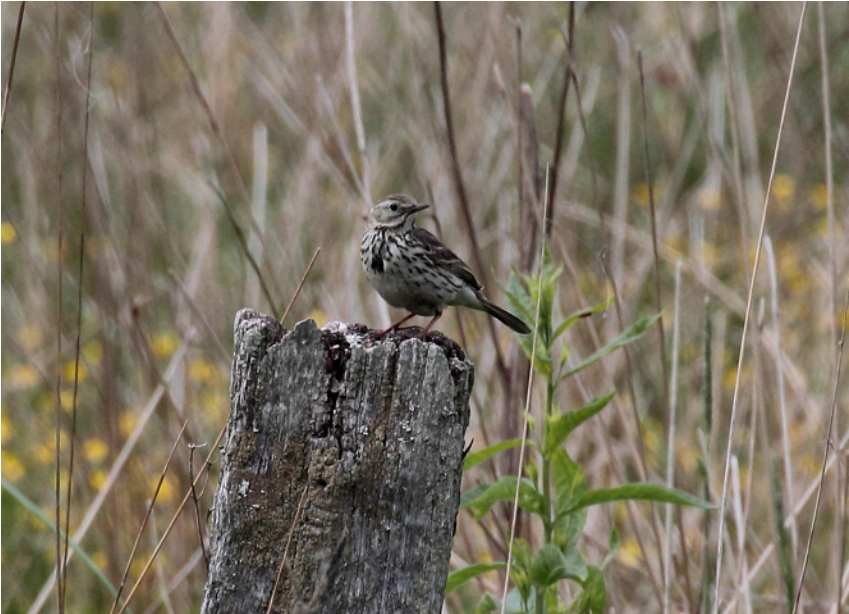
Ängsplärka på Ageröds ängar