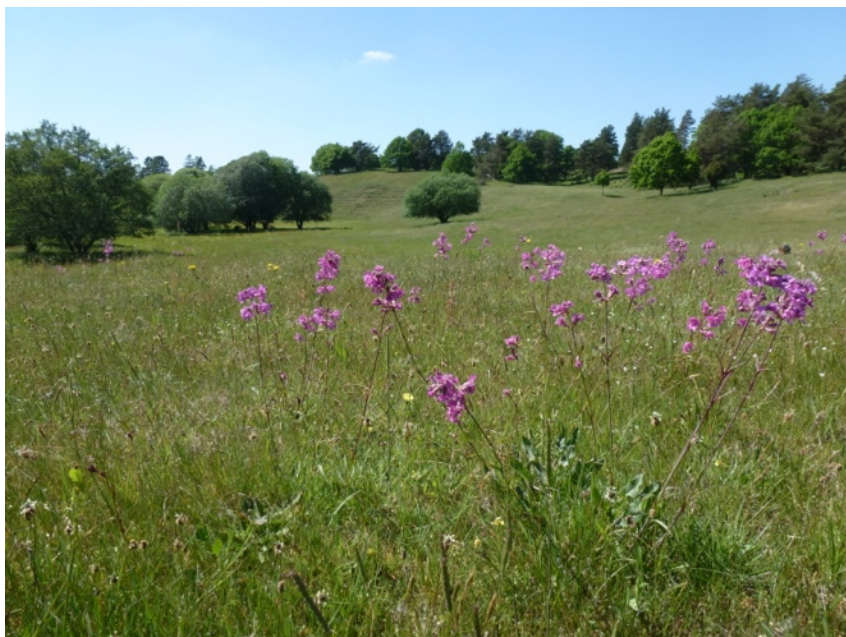
Utanför vandrarhemmet i utkanten av Ravlunda

Årets flerdagarsresa gick, efter önskemål, återigen till Österlen i Skåne, där det finns mycket intressant att beskåda. 17 personer deltog i resan. Nedan ses ett axplock av bilder från resan.