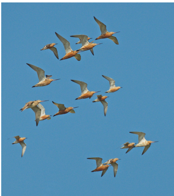
Myrspovar och kustsnäppor

Fristads naturskyddsförening bildades 1960 och har som sina främsta uppgifter att skydda naturen och att sprida intresse för densamma.