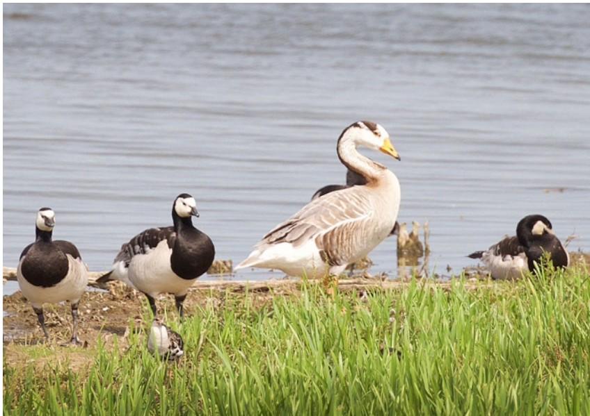
Vitkindade gäss, stripgås och brushane närmast i bild