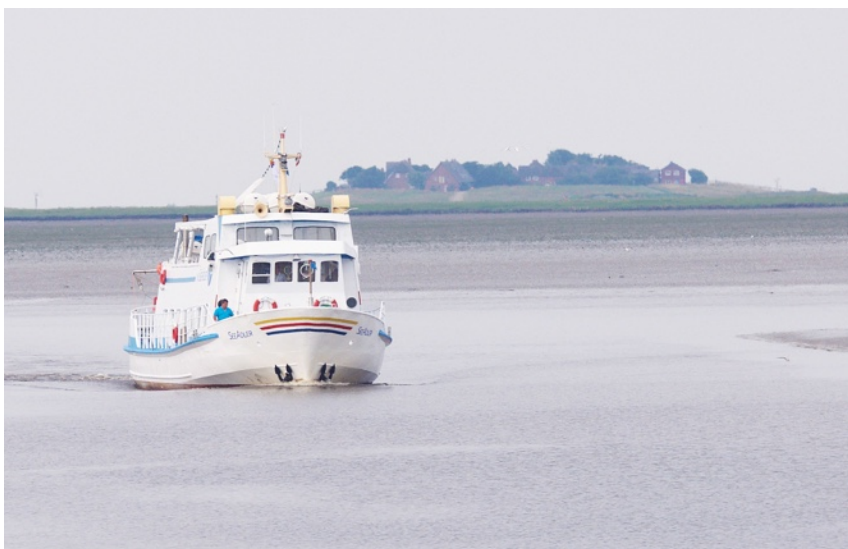
Vy från båten till Hallig Hooge