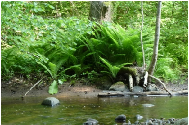
Strutbråken vid Verkeån väster om Brösarp i Skåne

Fristads naturskyddsförening bildades 1960 och har som sina främsta uppgifter att skydda naturen och att sprida intresse för densamma. Idag har föreningen drygt 170 medlemmar. Samarbete bedrivs med Borås naturskyddsförening, Fristads hembygdsförening och Studieförbundet.