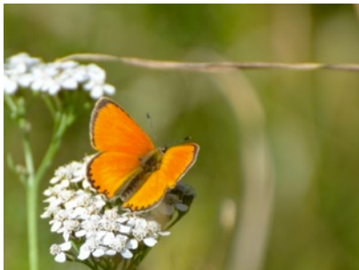
Guldvinge på röllika, Remmene skjutfält