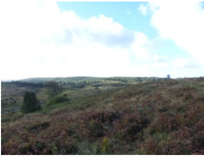
Sandsjöbacka ljunghed

Fågelskådning på Västkusten brukar alltid ge resultat. I augusti var flyttfågeln i gång och på de vanliga rastplatserna kunde vi titta på vadare och rovfåglar. Ett annat utflyktsmål vi besökt är Remmene skjutfält. Här kan man se fjärilar och beundra den vackra klockgentianan. Besöket i Sandsjöbacka naturreservat i september är också värt att notera. Det ligger i norra Halland och är känt för sina mäktiga ljunghedar. Vi valde att följa en av vandringslederna, som gick längs björnbärssnår i vackert sensommarväder.