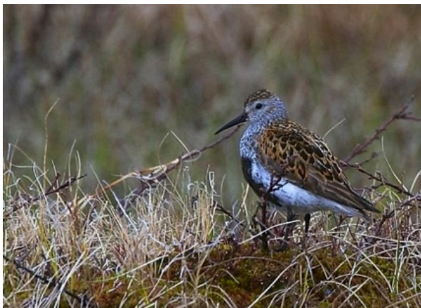
Kärrensnäppa i häckningsmiljö, Härjedalen 2015

Fristads naturskyddsförening bildades 1960 och har som sina främsta uppgifter att skydda naturen och att sprida intresse för densamma.