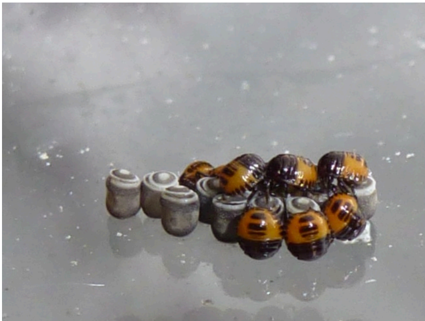
Nykläckta nymfer av bräsmabärfis