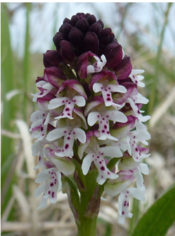
Krutbrännare, Gotland 2017

Fristads naturskyddsförening bildades 1960 och har som sina främsta uppgifter att skydda naturen och att sprida intresse för densamma.