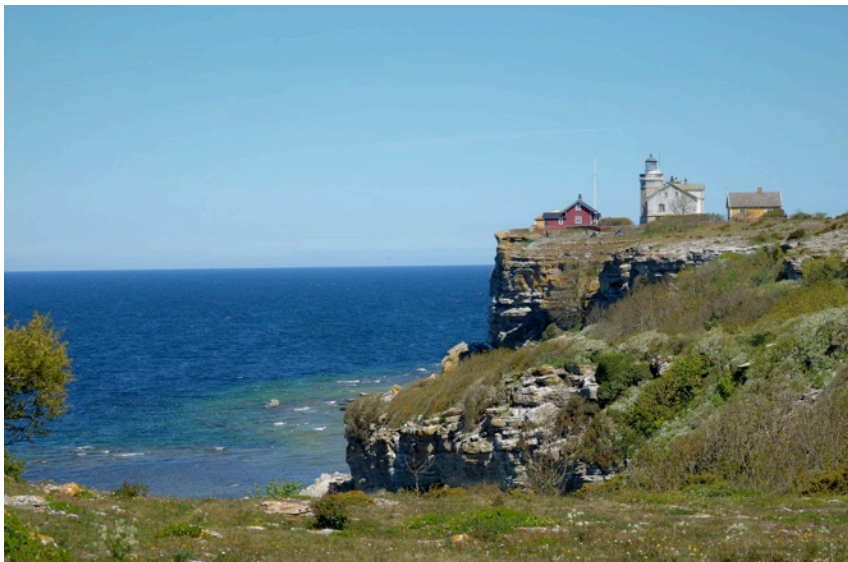
Fyren på Stora Karlsö