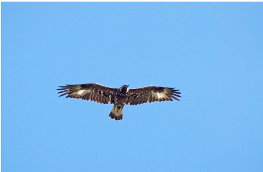
Kungsörn vid Hoburgen