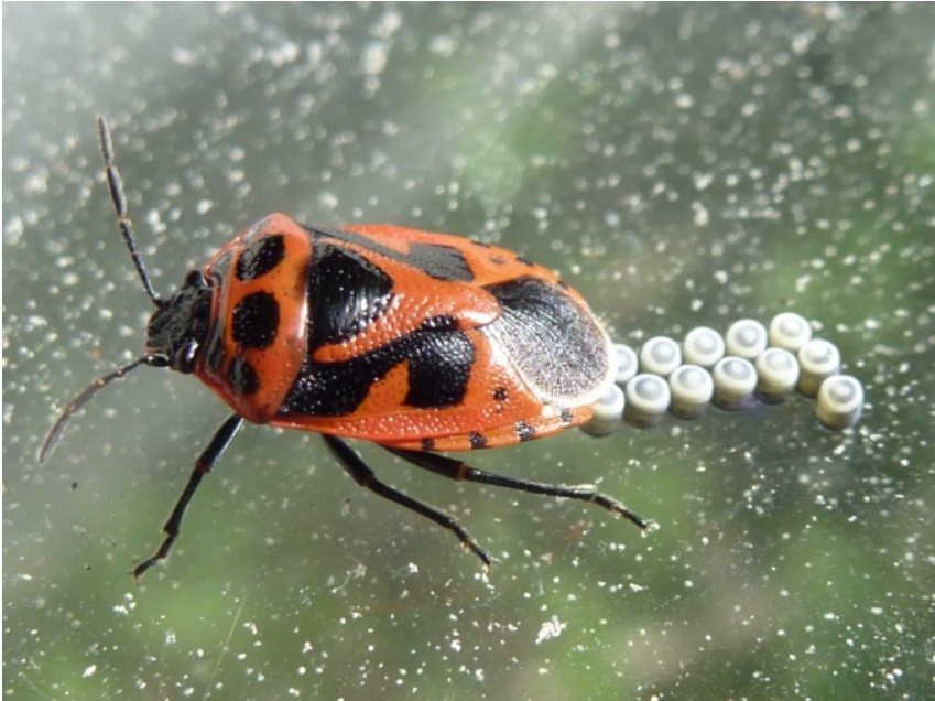
Äggläggning på drivbänksglas

arten och jag räknade som mest till åtta olika individer. Bräsmabärfisen är kategoriserad som nära hotad enligt rödlistan. Med spänning såg jag fram emot odlingsåret 2017 och om de skulle dyka upp igen.