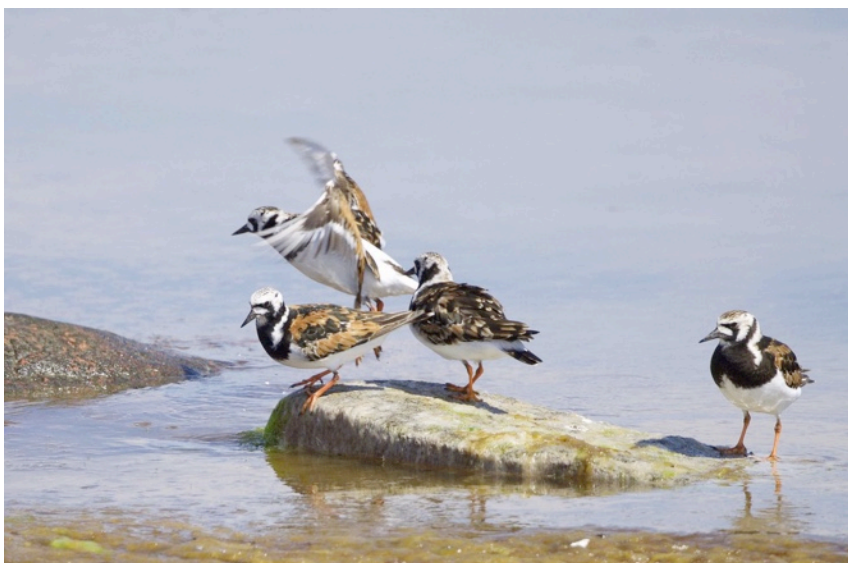
Roskarl vid Hoburgen