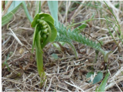
Låspräken på Mölarps ö

Nytt för året var mosskrattningen på Mölarps ö och den gemensamma bildvisningskvällen i november.