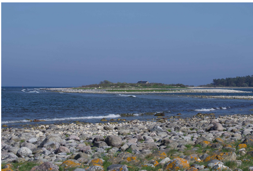
Ölands norra udde