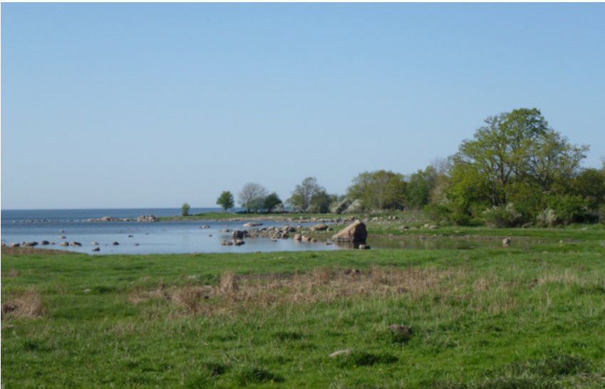
Havet utanför Halltorps hage