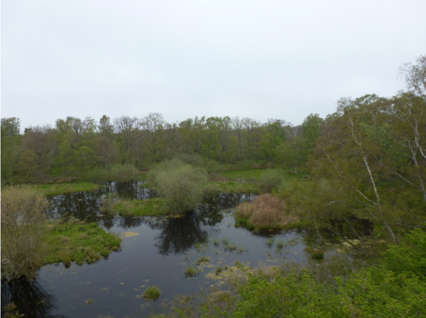
Smådoppingens damm i Södra Lunden, Ottenby