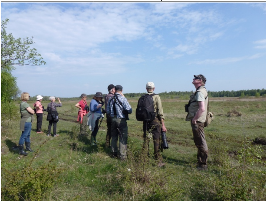
På spaning efter ängshök på Hörninge mosse