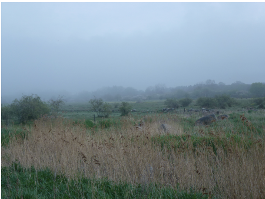
En dimmig morgon vid Västerstadsviken