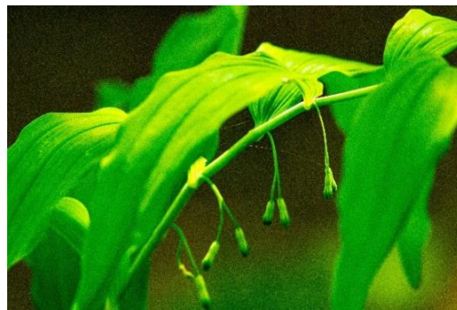
Storrams 1A Innanför grinden