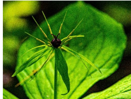
Giftigt Ormbär 1A Innanför grinden 10 m