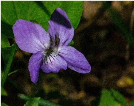
Skogsviol 1A innanför grinden ca 10m