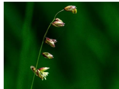
Bergsslok 4B ett gräs lätt att förbise