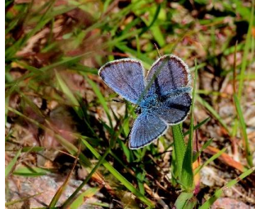
Slåttergubbe 2C m. Blåvinge